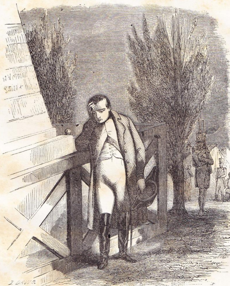
Napoléon visitant le tombeau de Gustave-Adolphe. (Chap. III.)

Le soir de cette journée, en racontant à Joséphine et à ceux qui se trouvaient avec elle dans le salon les détails de la visite qu'il avait faite le matin à ses petits lycéens , Napoléon lui dit :